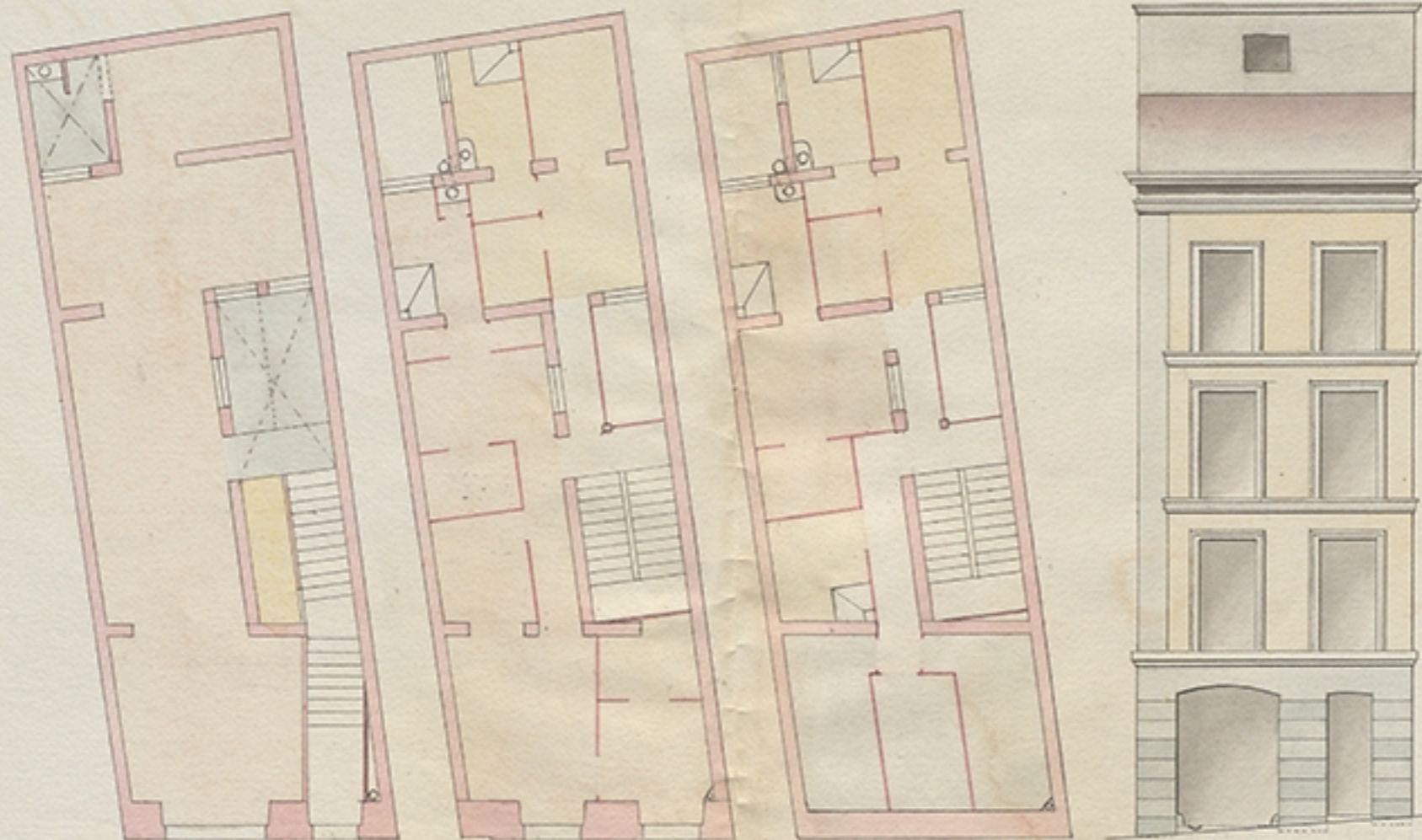
Escala de pies.